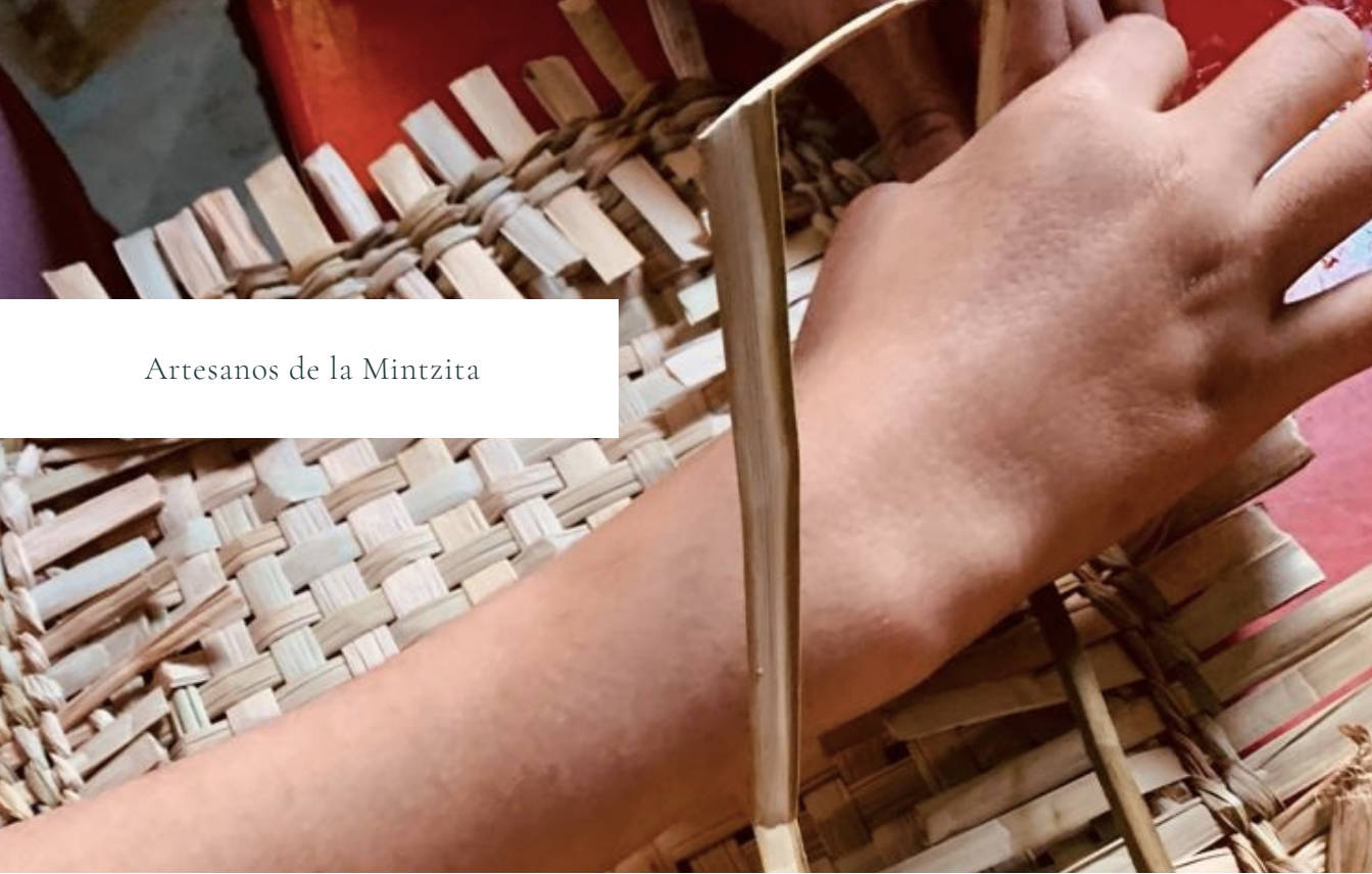
Artesanos de la Mintzita